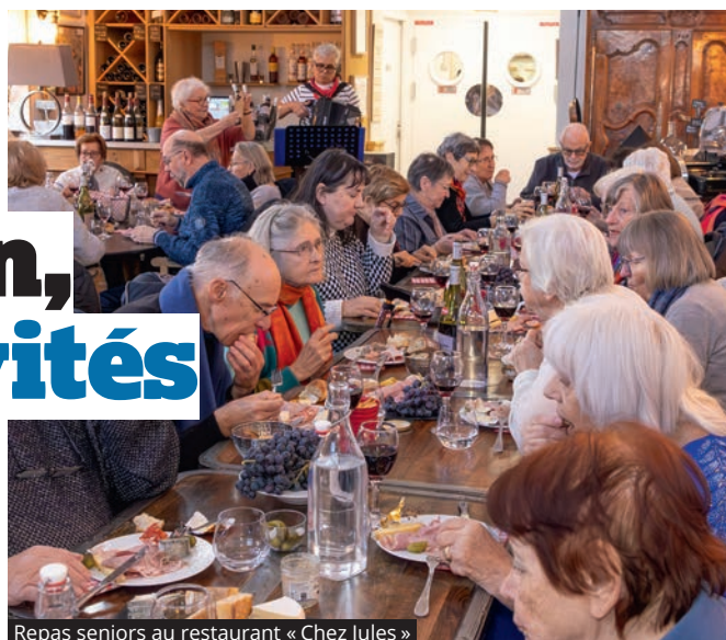
Repas seniors au restaurant « Chez Jules »

LES INSCRIPTIONS AU CLUB SENIORS POUR LES ACTIVITÉS DE JANVIER DÉBUTENT LUNDI 22 DÉCEMBRE. UNE ADHÉSION ANNUELLE QUI SE FAIT AUPRÈS DU SERVICE.