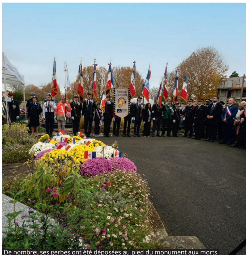
De nombreuses gerbes ont été déposées au pied du monument aux morts