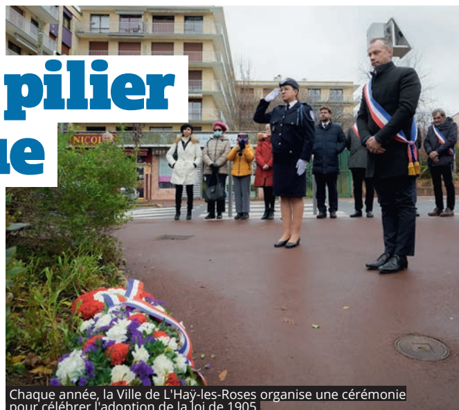
Chaque année, la Ville de L'Haÿ-les-Roses organise une cérémonie pour célébrer l'adoption de la loi de 1905

Fidèle à cet esprit, la Ville renouvelle chaque année son hommage à la loi de 1905. Rendez-vous à l'angle de l'avenue Aristide-Briand et de la rue Jean-Jaurès, le mardi 9 décembre à 11h, en présence du maire et des élus. Mais ce n'est pas tout. Pour sensibiliser, expliquer et promouvoir la laïcité, l'association L'Haïcité, en