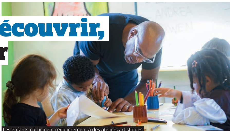
Les enfants participent régulièrement à des ateliers artistiques

Durant les différents temps périscolaires – le matin, pendant la pause méridienne et le soir après l'école – les mercredis et pendant les vacances, les petits L'Hayssiens profitent des activités variées proposées dans les 11 accueils de loisirs de L'Hay-les-Roses. « La