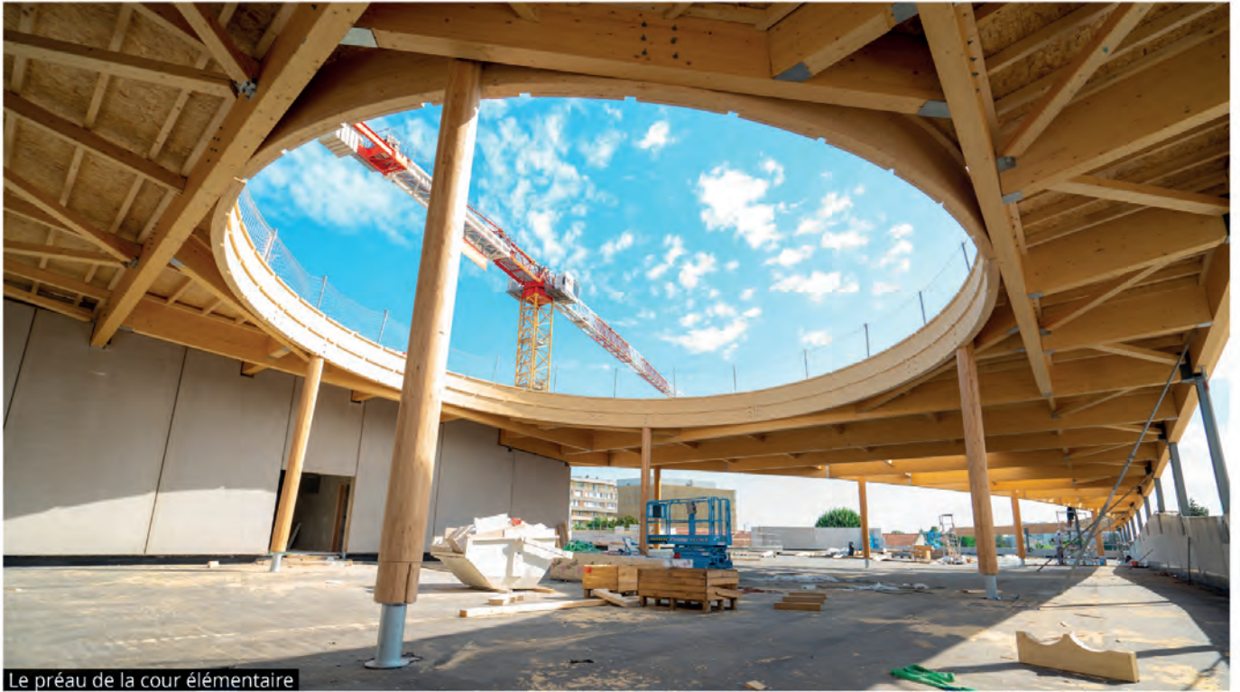
Le préau de la cour élémentaire