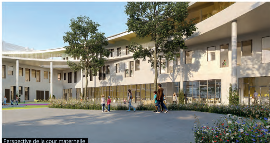
Perspective de la cour maternelle