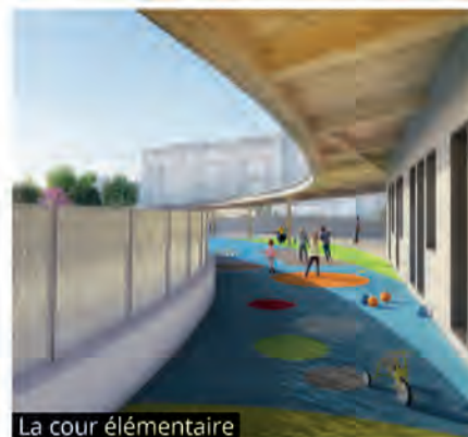
La cour élémentaire

À côté du futur groupe scolaire, un gymnase de plus de 1 000 m 2 (comportant une salle omnisports et un dojo) ouvrira également dans un an.