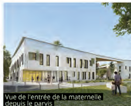
Vue de l'entrée de la maternelle depuis le parvis