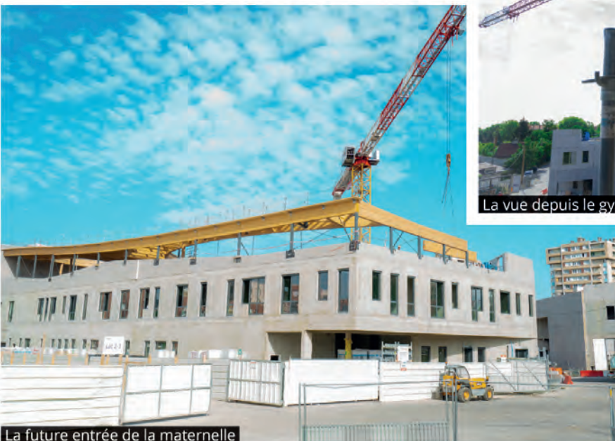
La future entrée de la maternelle