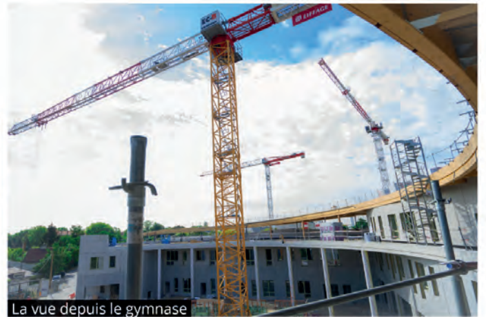
La vue depuis le gymnase