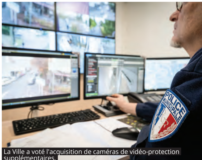
La Ville a voté l'acquisition de caméras de vidéo-protection supplémentaires.