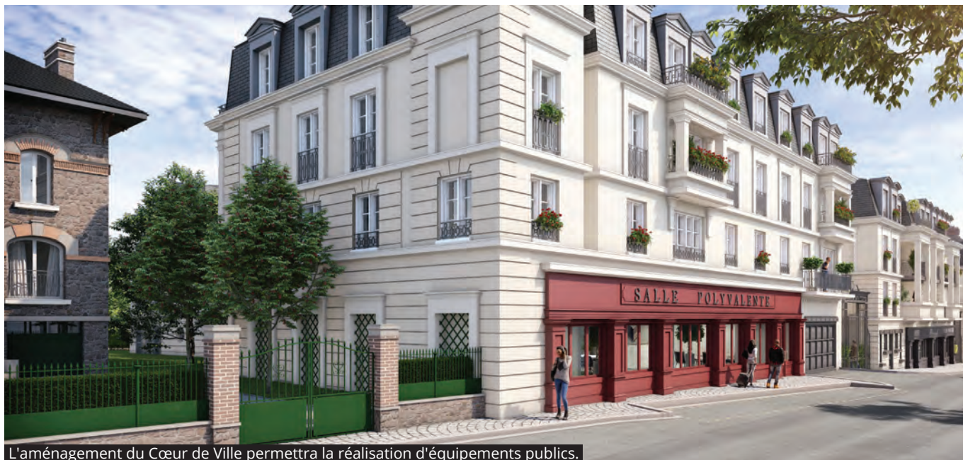
L'aménagement du Cœur de Ville permettra la réalisation d'équipements publics.