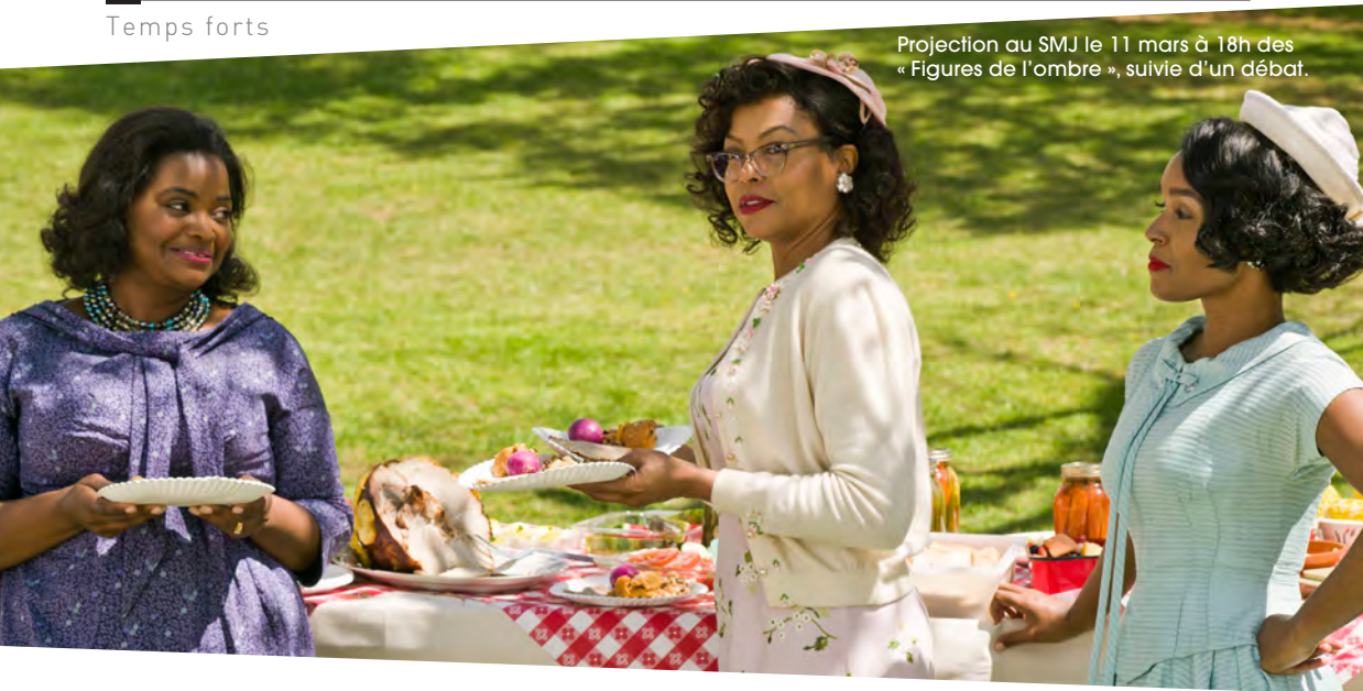
Projection au SMJ le 11 mars à 18h des « Figures de l'ombre », suivie d'un débat.