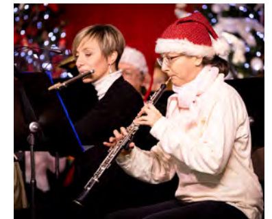
▲ Concert donné par l'Orchestre d'Harmonie de L'Hay-les-Roses, lors du Marché de Noël le 1 er décembre dernier.

De fil en aiguille, l'Orchestre d'Harmonie de L'Hay-les-Roses, composé essentiellement de musiciens amateurs réunis pour le plaisir de jouer, s'est présenté de nombreuses fois à des concours. Cors, trombones, basses, tubas, clarinettes, saxophones, batterie, percussions... De nombreux pupitres y sont représentés. Ils offriront pour l'occasion un répertoire composé d'œuvres variées (classique, jazz, variété, musique de film...), en y associant d'anciens chefs d'orchestre et musiciens de l'association. ■