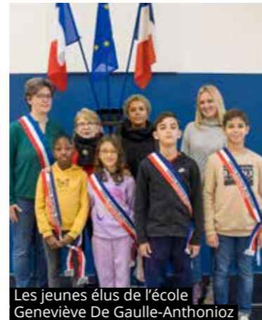
Les jeunes élus de l'école Geneviève De Gaulle-Anthonioz