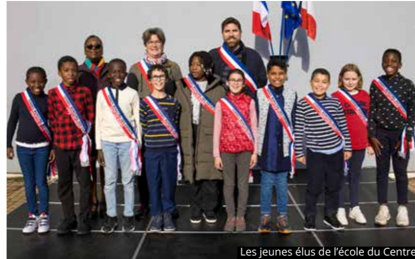
Les jeunes élus de l'école du Centre