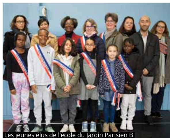
Les jeunes élus de l'école du Jardin Parisien B