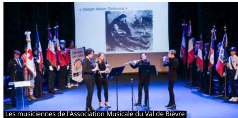
Les musiciennes de l'Association Musicale du Val de Bièvre