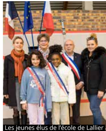
Les jeunes élus de l'école de Lallier