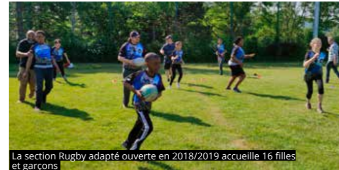
La section Rugby adapté ouverte en 2018/2019 accueille 16 filles et garçons

Grâce au dispositif « Si T BénéVole » de la Fondation des Amis de l'Atelier, les personnes accompagnées peuvent donner de leur temps au sein d'associations locales. C'est ainsi que des bénévoles de ce dispositif sont présents régulièrement à Ciné Relax. Le SAVS/SAMSAH joue également un rôle dans la prévention santé en amenant les personnes ac-