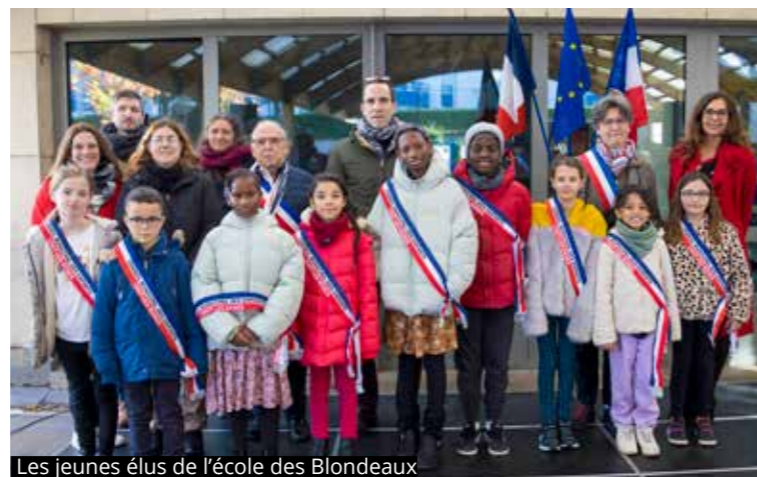
Les jeunes élus de l'école des Blondeaux