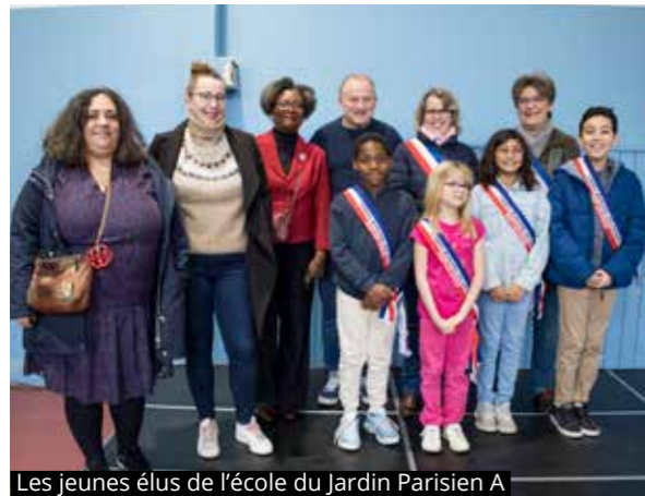
Les jeunes élus de l'école du Jardin Parisien A