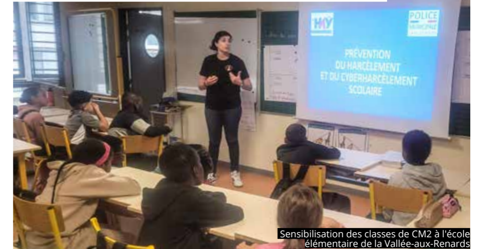
Sensibilisation des classes de CM2 à l'école élémentaire de la Vallée-aux-Renards

DU 10 NOVEMBRE AU 15 DÉCEMBRE, LES AGENTS DE LA POLICE MUNICIPALE SE SONT RENDUS DANS CHAQUE CLASSE DE CM2 DE LA COMMUNE. L'OBJECTIF : SENSIBILISER LES ÉCOLIERS SUR LE HARCÈLEMENT ET LE CYBER-HARCÈLEMENT EN MILIEU SCOLAIRE.