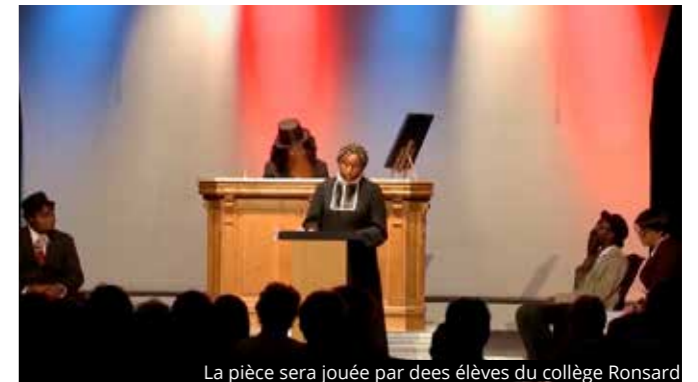
La pièce sera jouée par des élèves du collège Ronsard

laïcs et respectueux du pluralisme, ouvert à la reconnaissance d'intérêts divergents, d'opinions contraires, exprimées dans le respect de l'autre et de la diversité des engagements.