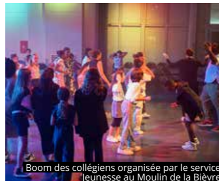
Boom des collégiens organisée par le service Jeunesse au Moulin de la Bièvre

Cent-cinquante jeunes L'Hayssiens ont participé à la boom organisée en octobre dernier. « Je tiens à saluer l'équipe du service Jeunesse qui a permis cette réussite. Ces temps festifs de partage et de découverte permettent de créer un premier lien avec les jeunes collégiens