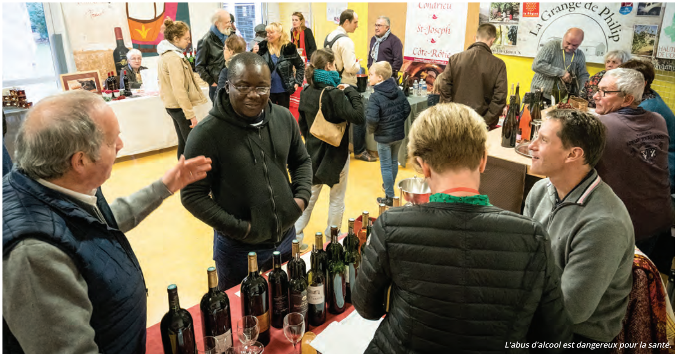
L'abus d'alcool est dangereux pour la santé.

Plus de 400 fins palais se sont rendus au Moulin de la Bièvre le week-end du 16 et 17 novembre, pour la 4 e édition du Salon des vins, organisé par le Lions Club Val de Bièvre, en partenariat avec la Ville. —