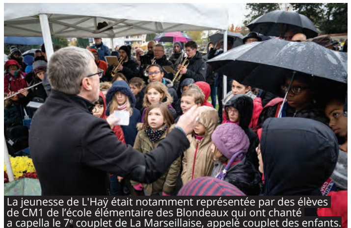
La jeunesse de L'Hay était notamment représentée par des élèves de CM1 de l'école élémentaire des Blondeaux qui ont chanté à capella le 7 e couplet de La Marseillaise, appelé couplet des enfants.