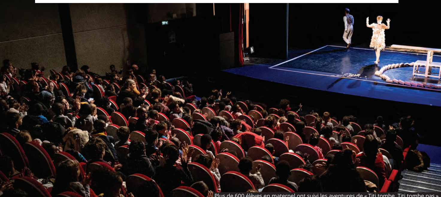
Plus de 600 élèves en maternel ont suivi les aventures de « Titi tombe, Titi tombe pas ».