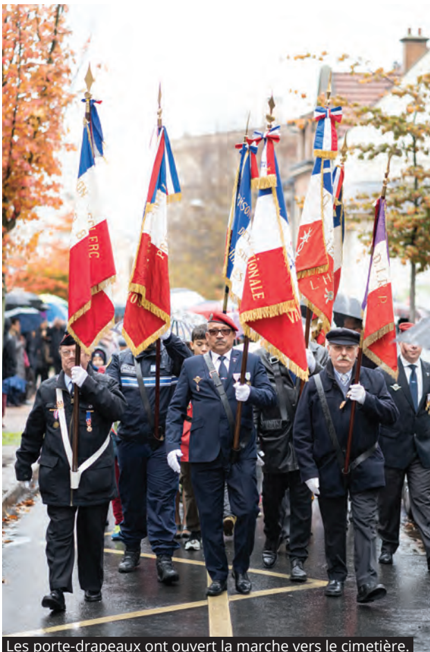
Les porte-drapeaux ont ouvert la marche vers le cimetière.