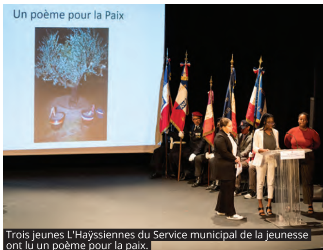
Trois jeunes L'Haÿssiennes du Service municipal de la jeunesse ont lu un poème pour la paix.