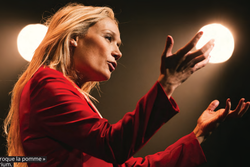
Spectacle « Caroline Vigneaux croque la pomme » le 27 février à 20h30 à l’Auditorium.