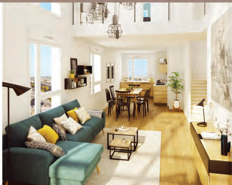
Exemple d'aménagement d'un 5 pièces duplex lot n°A62.