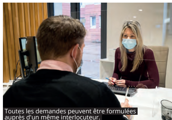
Toutes les demandes peuvent être formulées auprès d'un même interlocuteur.