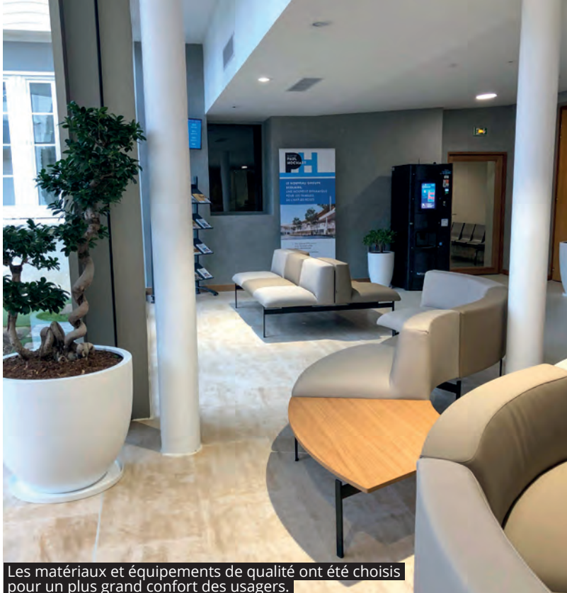
Les matériaux et équipements de qualité ont été choisis pour un plus grand confort des usagers.

C'est lumineux et bien éclairé, plus pratique aussi. Tous les services se trouvent à notre disposition, avec la borne pour effectuer ses démarches en ligne, une photocopieuse, un endroit pour faire ses photos, et même une machine à café. C'est convivial. On sent qu'un gros travail a été fait pour aménager l'Hôtel de ville et le résultat est au rendez-vous ».