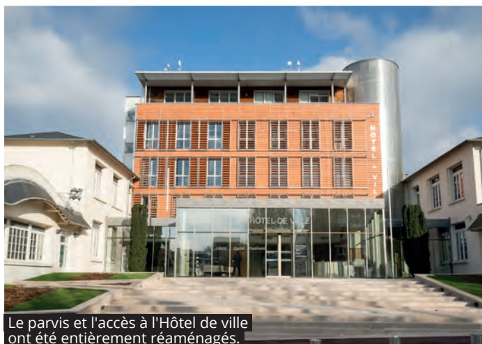
Le parvis et l'accès à l'Hôtel de ville ont été entièrement réaménagés.

Le rez-de-chaussée de l'Hôtel de Ville a été entièrement repensé afin d'améliorer la qualité d'accueil et la prise en charge des L'Haÿssiens. Ce sont au total 540 m 2 qui ont été aménagés pour les accueillir dans les meilleures conditions de confort, d'accessibilité et de confidentialité. Les locaux et le mobilier, accessibles aux personnes à mobilité réduite, ont été conçus pour tenir compte des spécificités des différents secteurs d'activité. Aussi, des espaces permettent d'accueillir sur un même poste de travail les différentes démarches des usagers grâce à la polyvalence des agents. « Les bureaux sont davantage conviviaux et confidentiels, ce qui favorise les échanges avec les administrés, témoigne Gwladys. Et d'ajouter : « Le choix des matériaux naturels, notamment le bois, donne également un côté plus chaleureux. Tout comme les plantes vertes qui apportent une bouffée d'oxygène supplémentaire ».