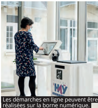
Les démarches en ligne peuvent être réalisées sur la borne numérique.