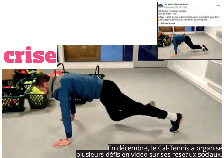
En décembre, le Cal-Tennis a organisé plusieurs défis en vidéo sur ses réseaux sociaux.

MALGRÉ LA CRISE SANITAIRE, LES ASSOCIATIONS SPORTIVES L'HAYSSIENNES TENTENT, TANT BIEN QUE MAL, DE CONTINUER À MAINTENIR LE LIEN SOCIAL AVEC LEURS ADHÉRENTS.