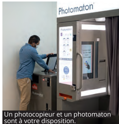
Un photocopieur et un photomaton sont à votre disposition.