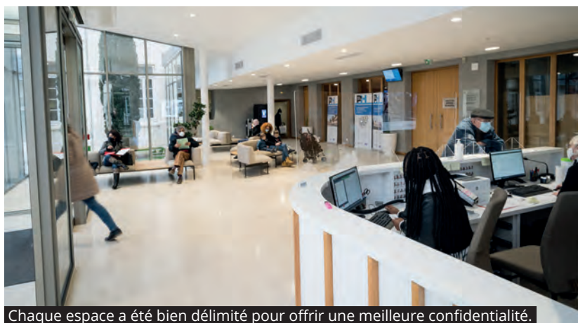
Chaque espace a été bien délimité pour offrir une meilleure confidentialité.