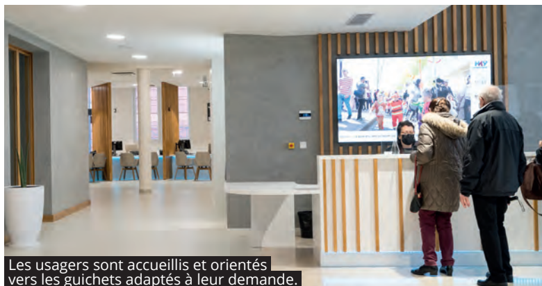
Les usagers sont accueillis et orientés vers les guichets adaptés à leur demande.

« Le nouvel aménagement est génial. L'espace d'accueil est grand et agréable et je le trouve bien agencé. Le bâtiment est un domaine que je connais bien, puisque j'étais peintre pendant toute ma carrière. J'ai d'ailleurs travaillé, il y a déjà plusieurs années, sur des grands projets à L'Haÿ et je trouve celui-ci particulièrement réussi. C'est vraiment très beau ».