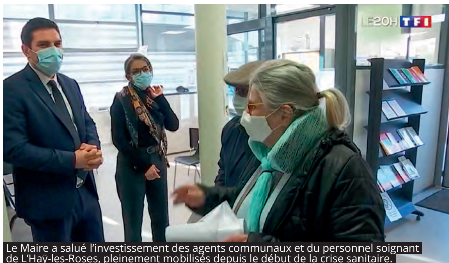
Le Maire a salué l'investissement des agents communaux et du personnel soignant de L'Haÿ-les-Roses, pleinement mobilisés depuis le début de la crise sanitaire.