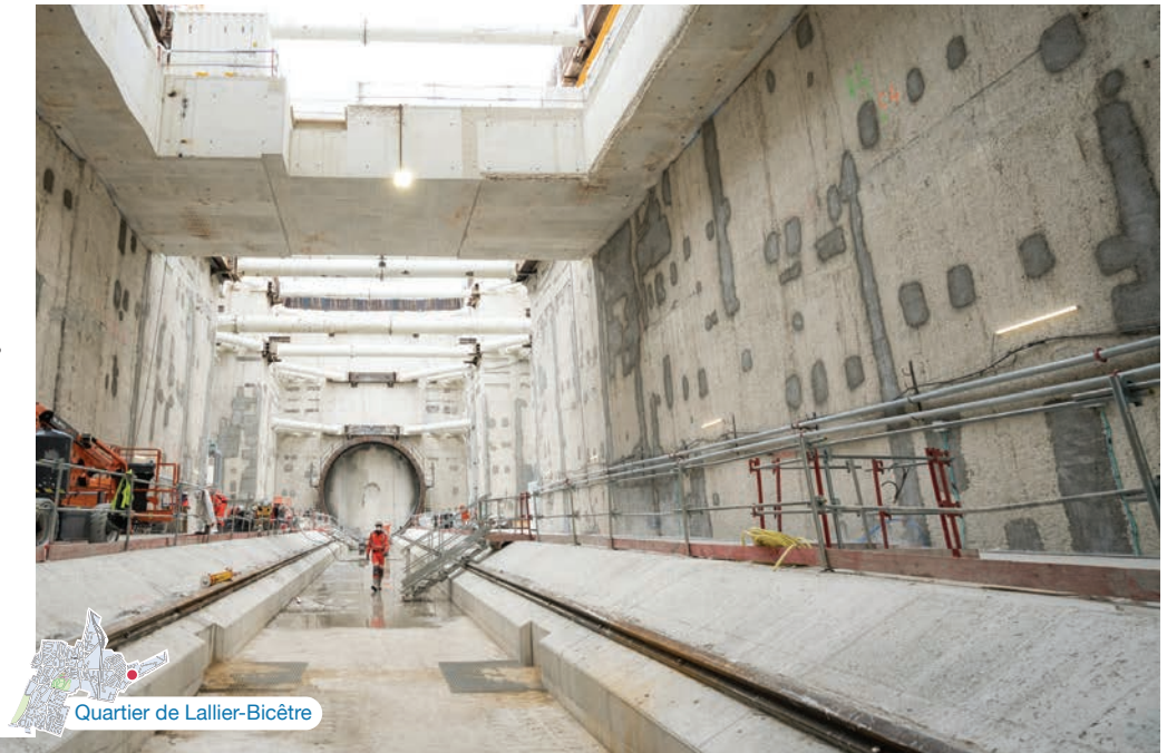
Quartier de Lallier-Bicêtre

La construction de la plateforme en béton au niveau du sol de la station s'est achevée en septembre sur le chantier de la future gare de L'HaÏ-Trois-Communes. Le tunnelier, en provenance de Thiais, a percé, le 28 septembre, l'extrémité sud avant de poursuivre le creusement du tunnel jusqu'au puits Jean Prouvé d'où il sera extrait en fin d'année. Trois tunneliers sont actuellement à pied d'œuvre pour la mise en service de la ligne 14 sud en 2024. —