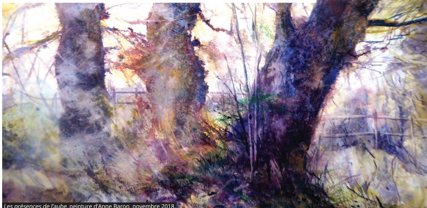
Les présences de l'aube, peinture d'Anne Baron, novembre 2018.