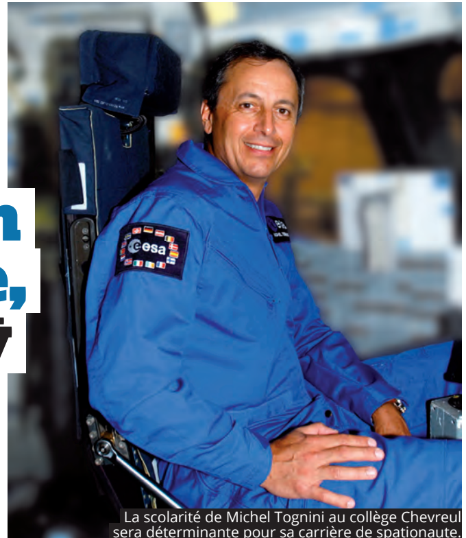
La scolarité de Michel Tognini au collège Chevreul sera déterminante pour sa carrière de spationaute.

« J'y ai rencontré des professeurs remarquables qui m'ont motivé et m'ont permis d'avoir des diplômes et d'avoir la