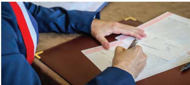
Figure représentative de la commune, le maire revêt une double casquette. Agent de l'État d'une part, sous l'autorité du préfet, il remplit des fonctions administratives, l'organisation des élections, la légalisation des signatures. Il est aussi officier d'état civil. En tant qu'organe exécutif de la commune, le maire est chargé de l'exécution des décisions du conseil municipal. Il peut déléguer certaines de ses attributions à un ou plusieurs adjoints. L'édile établit le budget et administre les

REPRÉSENTANT DE L'AUTORITÉ MUNICIPALE ET DU POUVOIR EXÉCUTIF AU NIVEAU COMMUNAL, LE MAIRE POSSÈDE DES ATTRIBUTIONS VARIÉES. DÉTAILS.