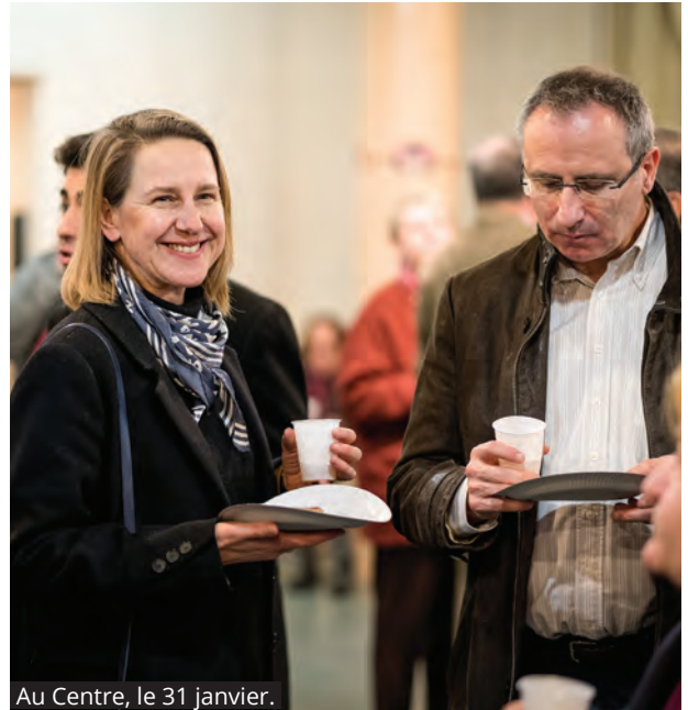
Au Centre, le 31 janvier.