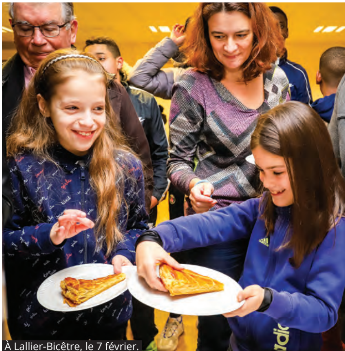
À Lallier-Bicêtre, le 7 février.