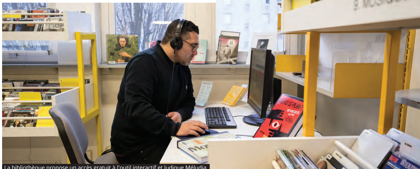
La bibliothèque propose un accès gratuit à l'outil interactif et ludique Méludia.