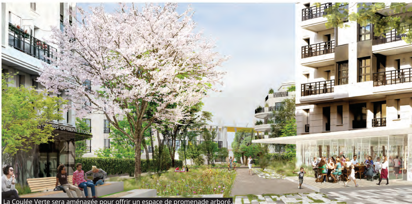
La Coulée Verte sera aménagée pour offrir un espace de promenade arboré.

de ville, en cohérence avec l'arrivée du métro en 2024 et de grands projets limitrophes dont l'Eco Campus Chérioux à Vitry-sur-Seine et l'implantation d'un cinéma, situé à proximité à Villejuif.