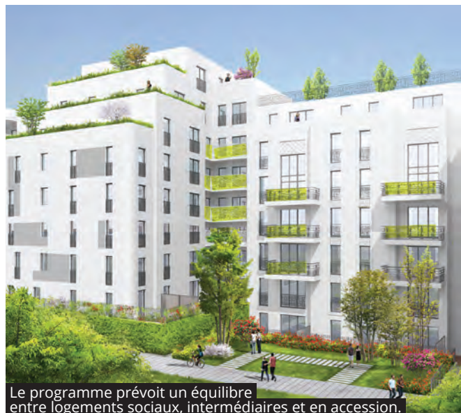
Le programme prévoit un équilibre entre logements sociaux, intermédiaires et en accession.

La Ville a souhaité rééquilibrer la répartition, mêlant une proportion plus importante de logements en accession à la propriété et de logements locatifs intermédiaires. Cette opération s'accompagnera de la déconstruction/reconstruction de la résidence sociale Coallia.