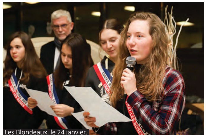
Les Blondeaux, le 24 janvier.