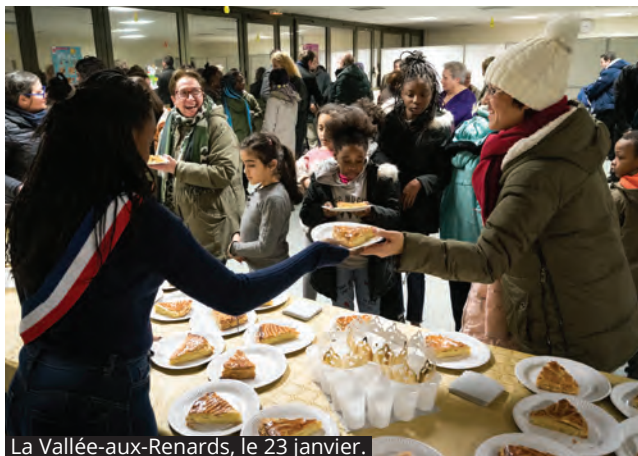
La Vallée-aux-Renards, le 23 janvier.