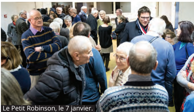
Le Petit Robinson, le 7 janvier.