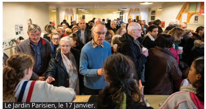
Le Jardin Parisien, le 17 janvier.