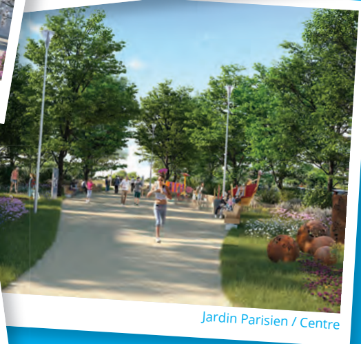
Jardin Parisien / Centre