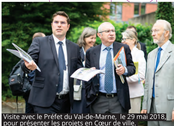
Visite avec le Préfet du Val-de-Marne, le 29 mai 2018, pour présenter les projets en Cœur de ville.

Chères L'Hayssiennes, Chers L'Hayssiens,