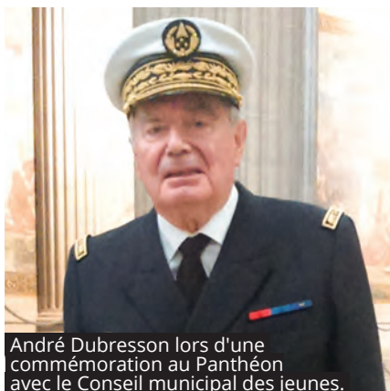
André Dubresson lors d'une commémoration au Panthéon avec le Conseil municipal des jeunes.

associer leurs talents autour de valeurs communes comme le fairplay et la solidarité, dans un esprit ludique et convivial. Ce projet concrétise cette première année riche en initiatives pour la jeune instance qui a vu le jour à l'automne et dont la séance plénière de fin de mandat a été organisée le 26 juin à l'Hôtel de ville. L'occasion pour les jeunes élus de se voir remettre des mains du Maire un diplôme d'engagement pour les féliciter de leur mandat. —