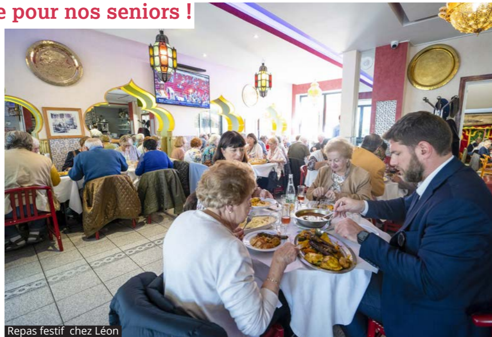
Repas festif chez Léon

Les bonnes habitudes reprennent ! Après deux années d'interruption en raison de la crise sanitaire, la semaine bleue fait son grand retour. Tous les ateliers proposés étaient complets. Les seniors l'hayssiens ont participé à de nombreuses activités : Tai-chi, sophrologie, loto, séance de cinéma, atelier de prévention routière animé par la Police Municipale ou encore un déjeuner chez Léon, avec deux danseuses. Une semaine bleue qui laissera aux nombreux participants de beaux souvenirs ! —