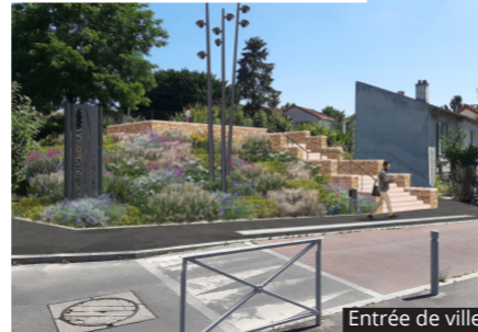
Entrée de ville