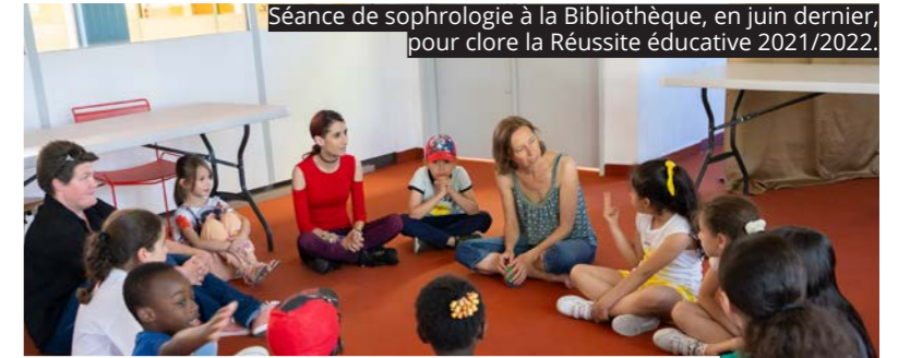
Séance de sophrologie à la Bibliothèque, en juin dernier, pour clore la Réussite éducative 2021/2022.