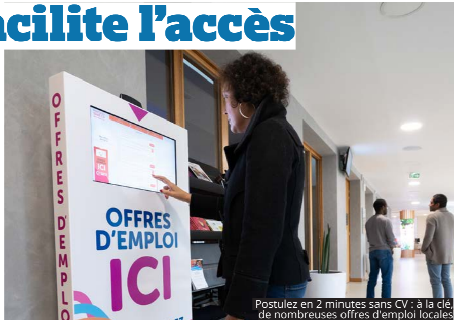
Postulez en 2 minutes sans CV : à la clé, de nombreuses offres d'emploi locales

LA VILLE S'ENGAGE POUR L'EMPLOI. ELLE ORGANISE RÉGULIÈREMENT DES ÉVÉNEMENTS SUR LE SUJET ET VIENT D'INSTALLER UNE BORNE DANS LE HALL DE L'HÔTEL DE VILLE QUI PROPOSE DES OFFRES D'EMPLOI LOCALES.