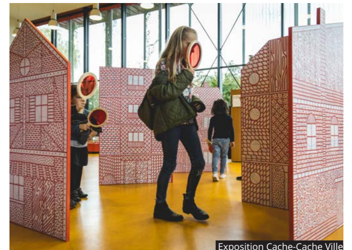
Exposition Cache-Cache Ville

DU 12 NOVEMBRE AU 31 DÉCEMBRE, C'EST LE GRAND RETOUR DE L'HAÏ EN LIVRES, LE FESTIVAL ANNUEL DE LITTÉRATURE JEUNESSE SUR LE THÈME «VIVRE LA VILLE». UNE PROGRAMMATION FOISSONNANTE EXPLORÉ LES MILLE ET UN ASPECTS DE LA VILLE ET TISSE SA TOILE AUTOUR DE MULTIPLES EXPOSITIONS À EXPLORER.