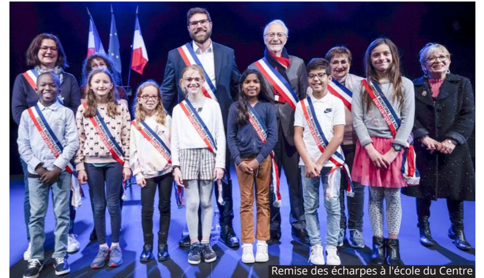
Remise des écharpes à l'école du Centre

En octobre, les nouveaux élus du Conseil Municipal des Enfants ont reçu leurs écharpes. Elus par leurs camarades, ces derniers ont été intronisés en présence du Maire et des élus de la ville. Un séminaire, organisé le 19 octobre, a permis aux jeunes conseillers de se rencontrer, mais aussi de se positionner sur des thématiques sur lesquelles ils travailleront durant leur mandat d'un an. —