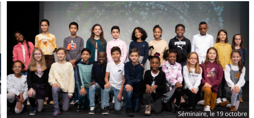
Séminaire, le 19 octobre