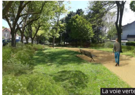
La voie verte

LA COULÉE VERTE VA ÊTRE RÉAMÉNAGÉE POUR EN FAIRE UN LIEU DE PROMENADE, DE CONVIVIALITÉ ET DE DÉTENTE. ELLE SERA DÉDIÉE AUX PIÉTONS ET AUX VÉLOS, AVEC UN CHEMINEMENT ALLANT DE CHEVILLY-LARUE AU SUD À CACHAN, AU NORD. D'ORES ET DÉJÀ, UNE PORTION A ÉTÉ RÉAMÉNAGÉE LE LONG DE LA HALLE DES SAVEURS.