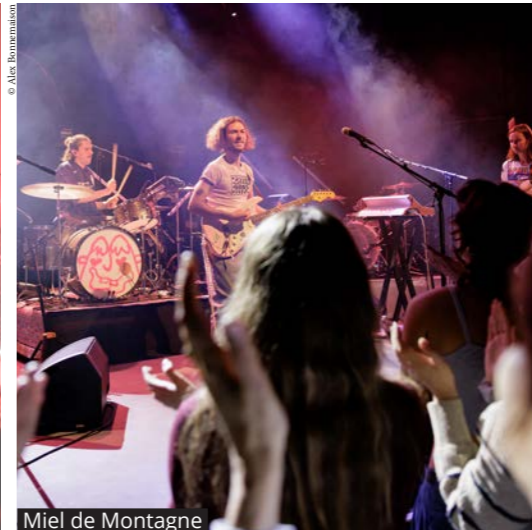
Miel de Montagne