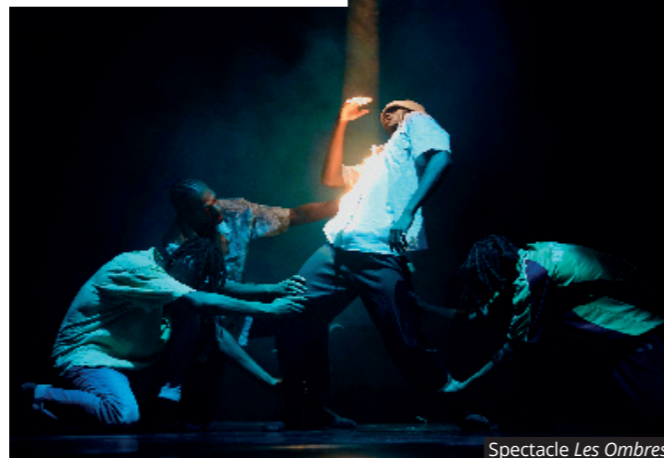
Spectacle Les Ombres

LE FESTIVAL KALYPSO EST DE RETOUR À L'HAÏ POUR SA 10 e ÉDITION. AU PROGRAMME DE CE MOIS-CI À L'ESPACE CULTUREL DISPAN DE FLORAN, DEUX TEMPS FORTS AVEC LES SPECTACLES «VOILÀ» ET «LES OMBRES» ET LE STAGE DE DANSE DE LA COMPAGNIE PARADOX-SAL.